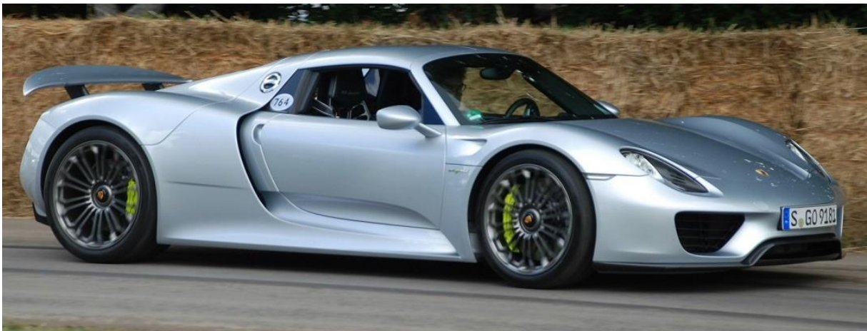
Porsche 918 Spyder: Quelle: porsche.com

Ist dieser Vergleich nicht reichlich unfair der BMW gegenüber? Wenn man allein den Aufwand betrachtet, den Porsche bei diesem High-Tech-Produkt betreibt, könnte man leicht zu dieser Auffassung gelangen. Nachzulesen unter http://www.spiegel.de/auto/fahrberichte/porsche-918-das-staerkste-schnellste-teuerste-auto-aus-deutschland-a-935866.html . Einzig und allein das Leistungsgewicht bewirkt einen kleinen Schimmer Hoffnung für die BMW.