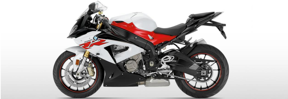
BMW S 1000 RR

Man könnte das Duell auch BMW gegen Porsche nennen, oder 17.400 Euro gegen 768.026 Euro, oder ein Serienfahrzeug von der Stange gegen ein nach allen Regeln der Kunst hochgezüchtetes Sportgerät, oder zwei Räder gegen vier Räder. In AutoBild vom 12. Mai 2017 geht es darum, wer schneller auf 300 km/h beschleunigt, ein Porsche 918 Spyder oder eine BMW S 1000 RR .