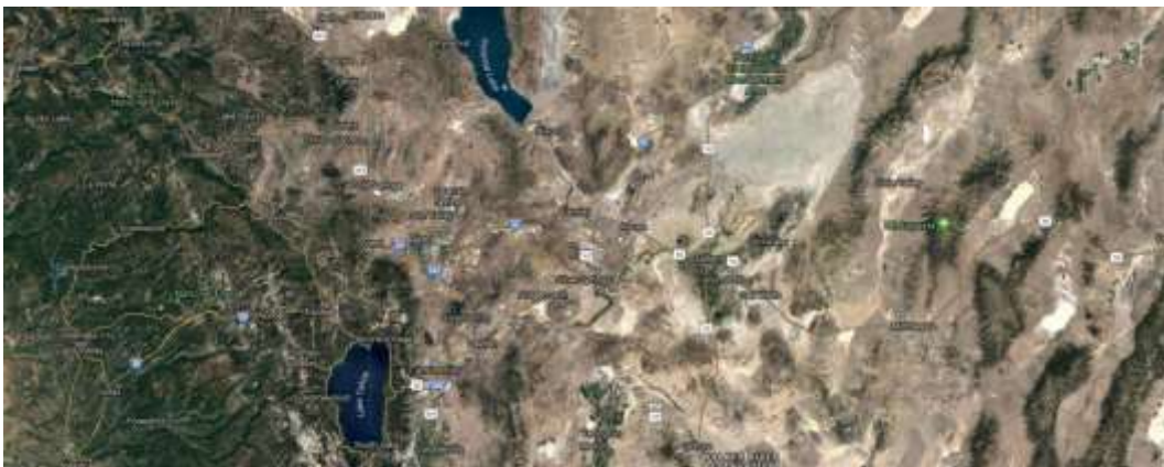
Reno - Nevada

Die Frage lautet, wie lange noch? Wollen wir wirklich zusehen, bis ähnliche Bedingungen herrschen wie in Nevada?