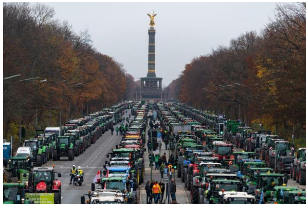
Fendt Vario: 6-Zylinder MAN-Motor, 12,4 Liter Hubraum, Leistung 517 PS, Leergewicht 14 Tonnen, Allradantrieb mit Torque Distribution, Reifendurchmesser max. 2,35 Meter, Vmax. 60 km/h, variable Reifendruckanlage, 3-fach pneumatische Kabinenfederung mit integrierter Niveauregulierung, aktiv gekühlte Kühlboxen, ca. 250.000 Euro

Bekommen die jetzt alle eine Anzeige wegen Verkehrsbehinderung, analog den Klimaklebern? Einmal dürfen Sie raten. Die Rücknahme der Minderbesteuerung wird flugs wieder zurückgenommen. Kommt Ihnen das bekannt vor? Richtig, vom Atomausstieg. Das baut mächtig Vertrauen auf in unsere Politiker.